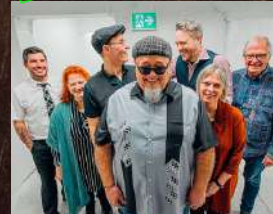
MICH AND THE BLUES BASTARDS

Prix : 45 $ (50$ à la porte) Bar et casse-croûte sur place Ouverture des portes à 18 h